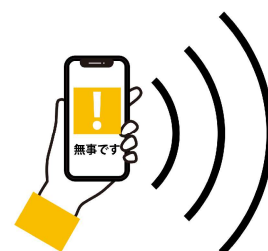
災害時 従業員・家族の 安否確認訓練