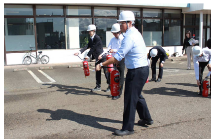
火災を想定 消火器訓練