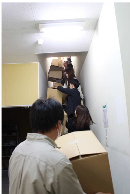
信濃川氾濫を想定 水害対策訓練 (重要物リレー運搬)