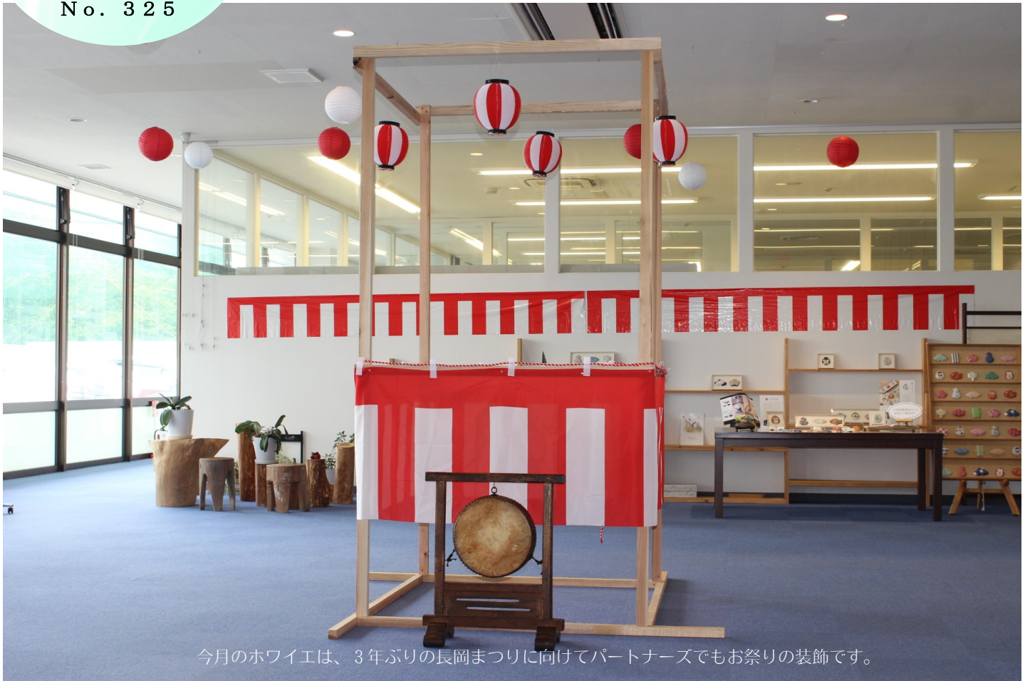
今月のホワイエは、3年ぶりの長岡まつりに向けてパートナーズでもお祭りの装飾です。