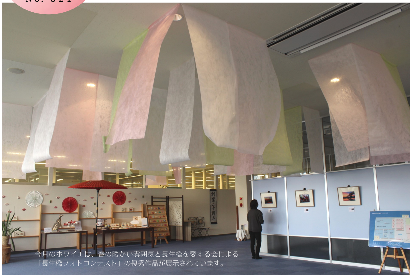
今月のホワイエは、春の暖かい雰囲気と長生橋を愛する会による「長生橋フォトコンテスト」の優秀作品が展示されています。