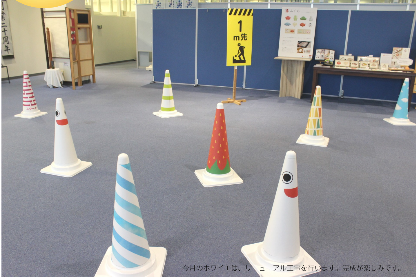
今月のホワイエは、リニューアル工事を行います。完成が楽しみです。