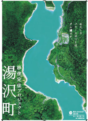
グランプリ うみがたり 新聞広告