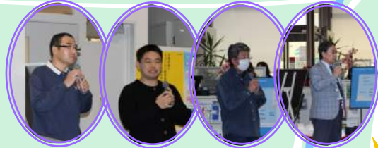
大清掃の後のPLAZA終礼