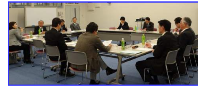
(写真：グループ会議の様子)