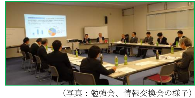
(写真：勉強会、情報交換会の様子)