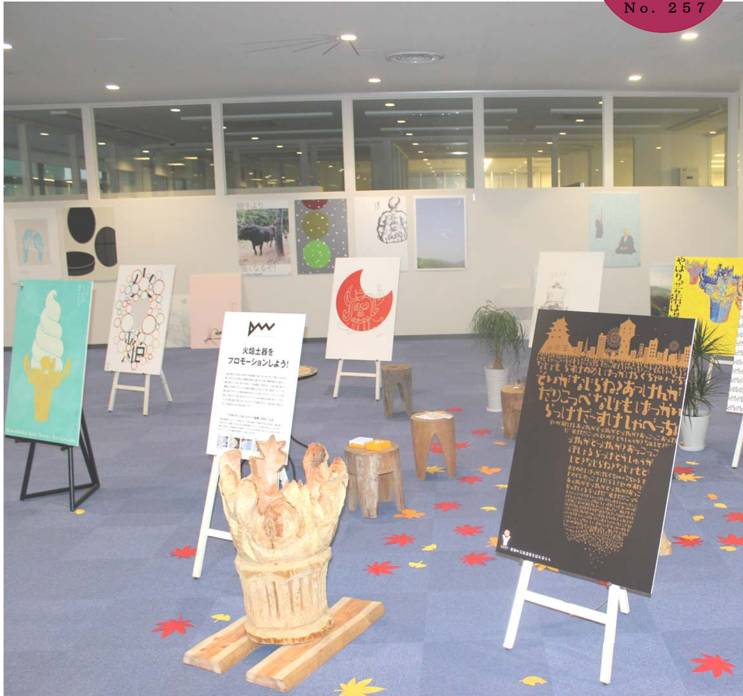
皆様、火焰土器はご存じでしょうか？初めて出土したのは新潟県長岡市だそうです。