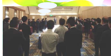
（写真：懇親会の様子）