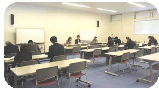
(写真：年度更新説明会の様子)

4月に入ると、社会保険労務士法人にとって一番の繁忙期となる、労働保険事務組合の年度更新業務が始まります。これに先立ち、3月28日に事務組合主催の年度更新説明会を行いました。今年度は建設業の現場労災について改正が行われたこともあり、例年を上回る14名の申込みがありました。年度更新の事務について改正点も含め弊社従業員より説明を行い、活発な質疑が行われました。（大谷）