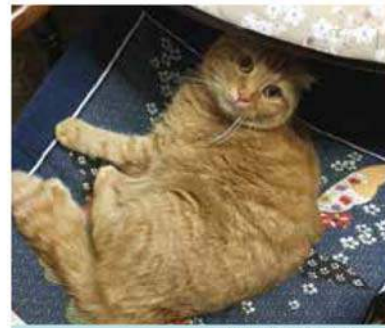
新しい相棒・ポーチちゃん

スーパーマーケットトレードショー 公式サイト: http://www.smts.jp/