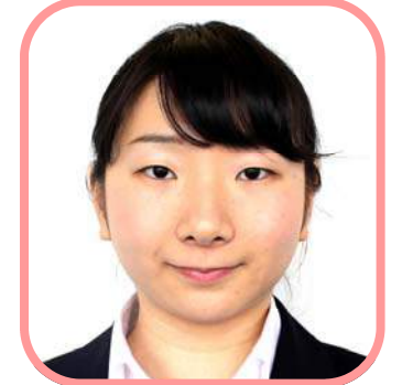
税理士法人 小宮 姿名子 こみや しなこ