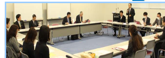
(写真:12月11日 事業再生研修会の様子)