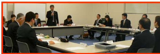
(写真:12月11日 グループ会議の様子)

12月11日(金)16時30分より、PLAZA内・夢空間(研修室)を会場にグループ会議が開催されました。当日は総勢19名の方が出席され、グループ会員の皆様の近況報告をしていただきました。