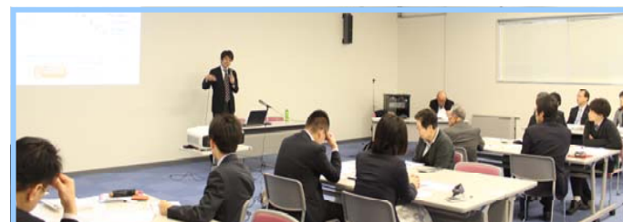
(写真:12月4日 事業再生研修会の様子)

主催:株式会社パートナーズプロジェクト 日時:12月11日(金) 15:15~16:30 場所:PLAZA内・夢空間(研修室) 参加者:25名 テーマ:経営改善計画策定支援について