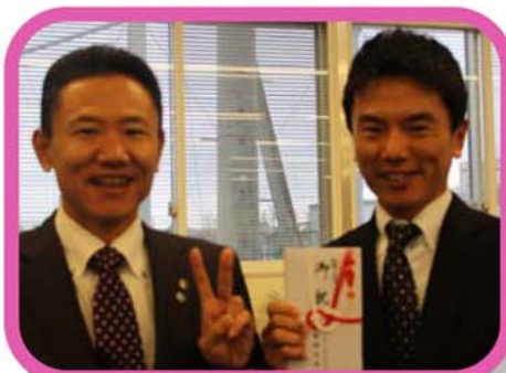
(写真:勤続表彰時の様子)